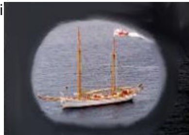
Campo visivo danneggiato

Il glaucoma è considerato "il ladro silenzioso della vista" in quanto, nella maggior parte dei casi, è una patologia a decorso asintomatico e si manifesta quando è già in uno stadio avanzato, portando, se non riconosciuto e curato, inevitabili