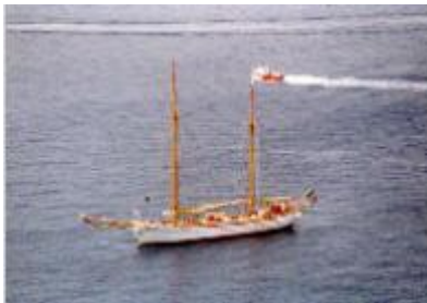
Campo visivo normale

È fondamentale ed importante eseguire una diagnosi precoce! Occorre intervenire tempestivamente (specialmente in quelle persone che già in famiglia hanno un parente affetto da glaucoma, infatti l'ereditarietà della malattia è molto frequente) prima che i danni al nervo ottico ed al campo visivo siano subentrati.