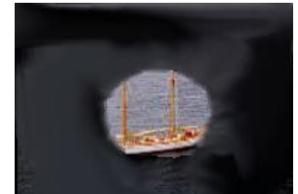
Campo visivo molto danneggiato

Qualora l'esame evidenziasse un'evidenza o un dubbio diagnostico sarà nostra cura indirizzare il paziente ai successivi accertamenti diagnostici ed all'eventuale terapia.